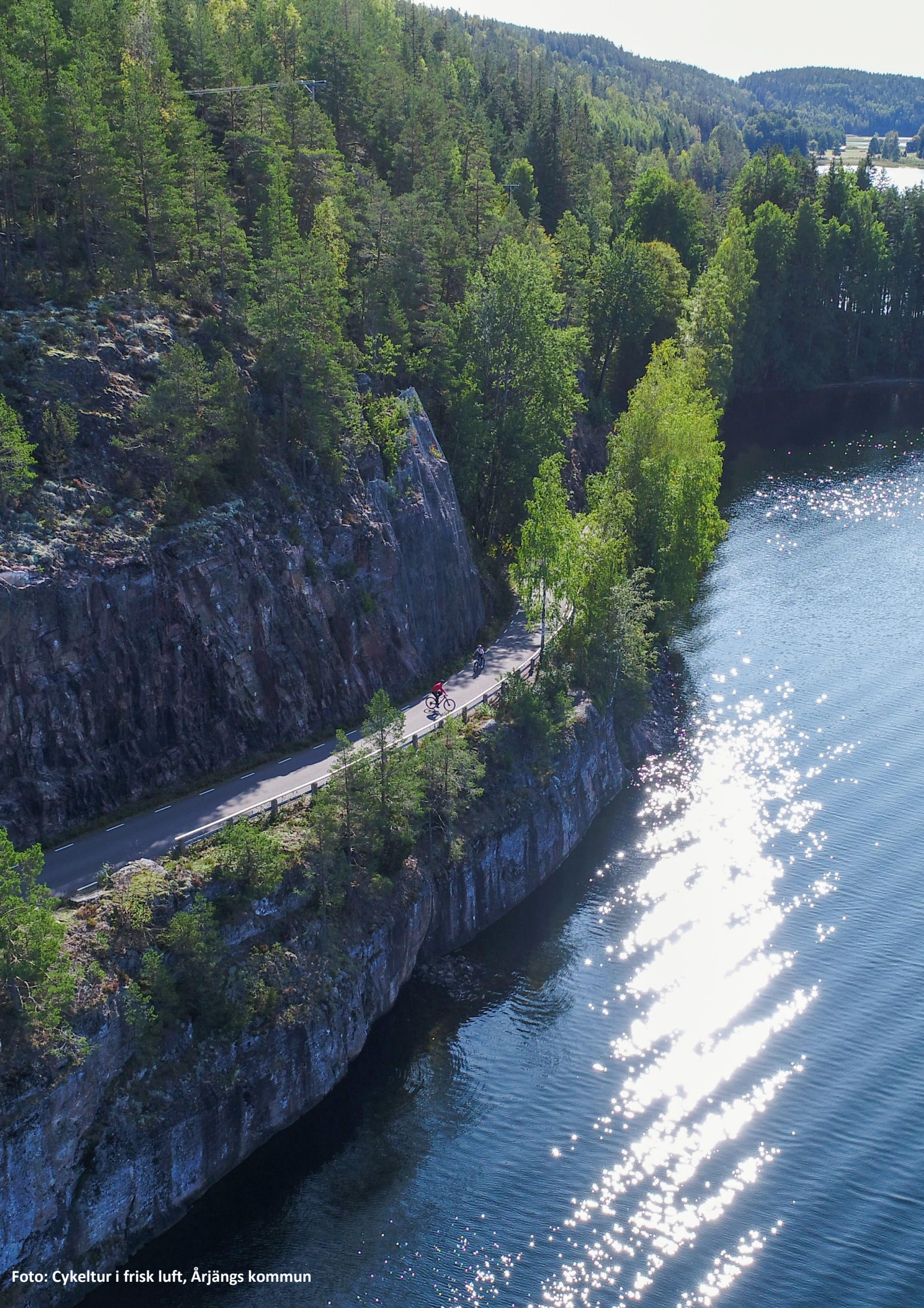
Foto: Cykeltur i frisk luft, Årjängs kommun