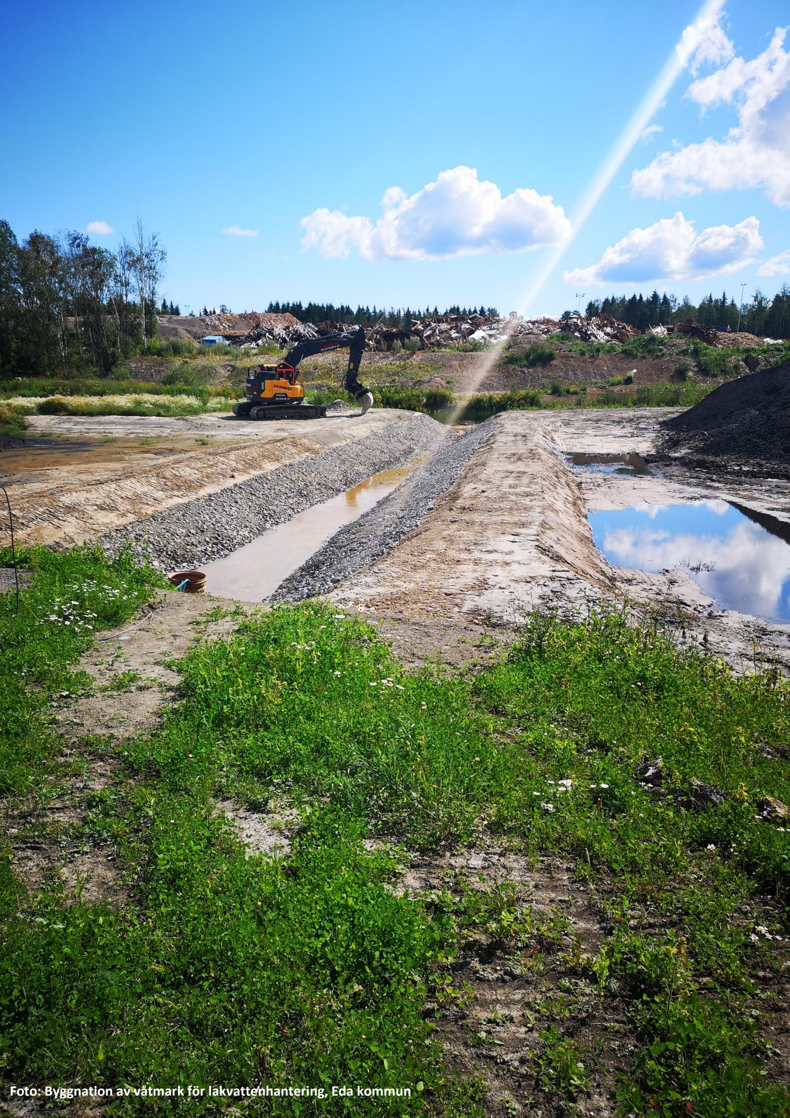
Foto: Byggnation av våtmark för lakvattenhantering, Eda kommun