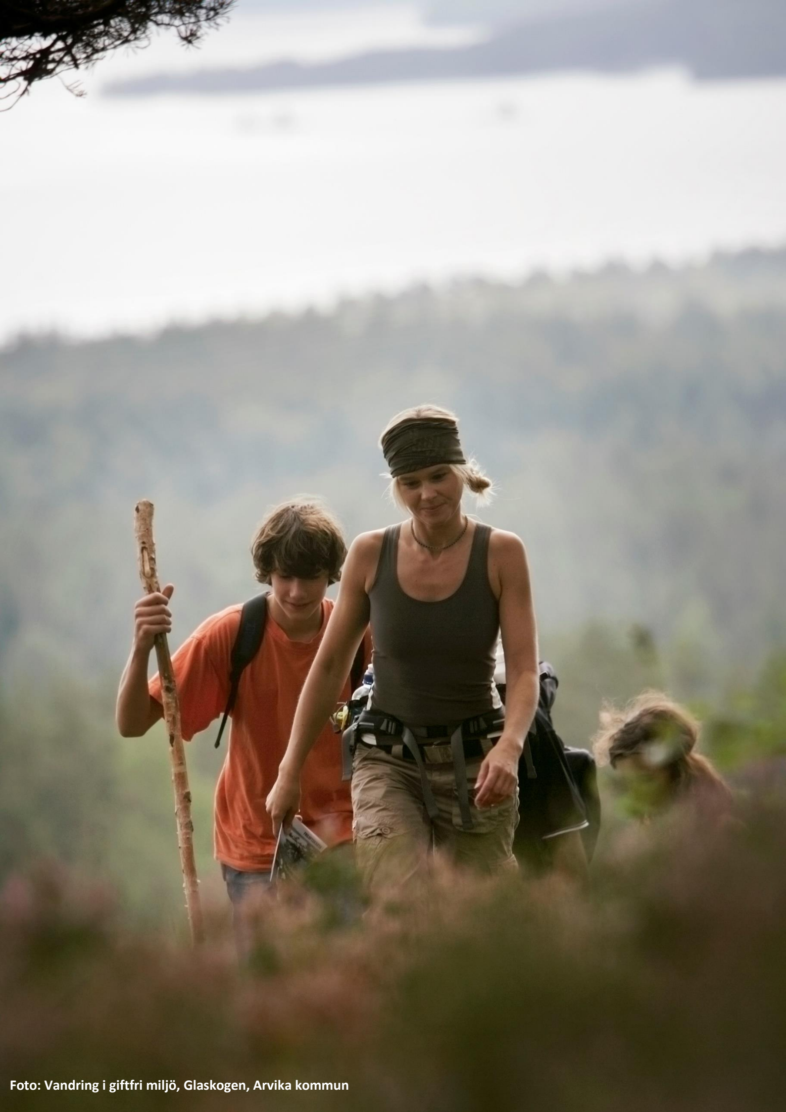
Foto: Vandring i giftfri miljö, Glaskogen, Arvika kommun