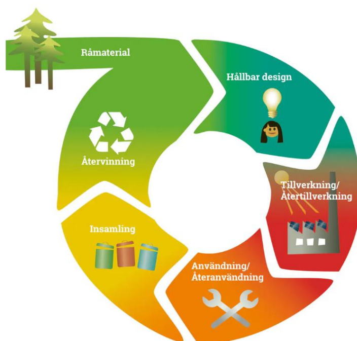
Figur 1. Schematisk bild över cirkulär ekonomi.

För att klara de ambitiösa klimat- och miljömål som beslutats på internationell, nationell, regional och lokal nivå måste avfallsmängderna minska. Det handlar bland annat om att köpa mindre, återbruka mera och förpacka produkter på ett bättre sätt. Det avfall som uppstår måste hanteras på ett miljömässigt bättre sätt genom materialåtervinning eller biologisk behandling.